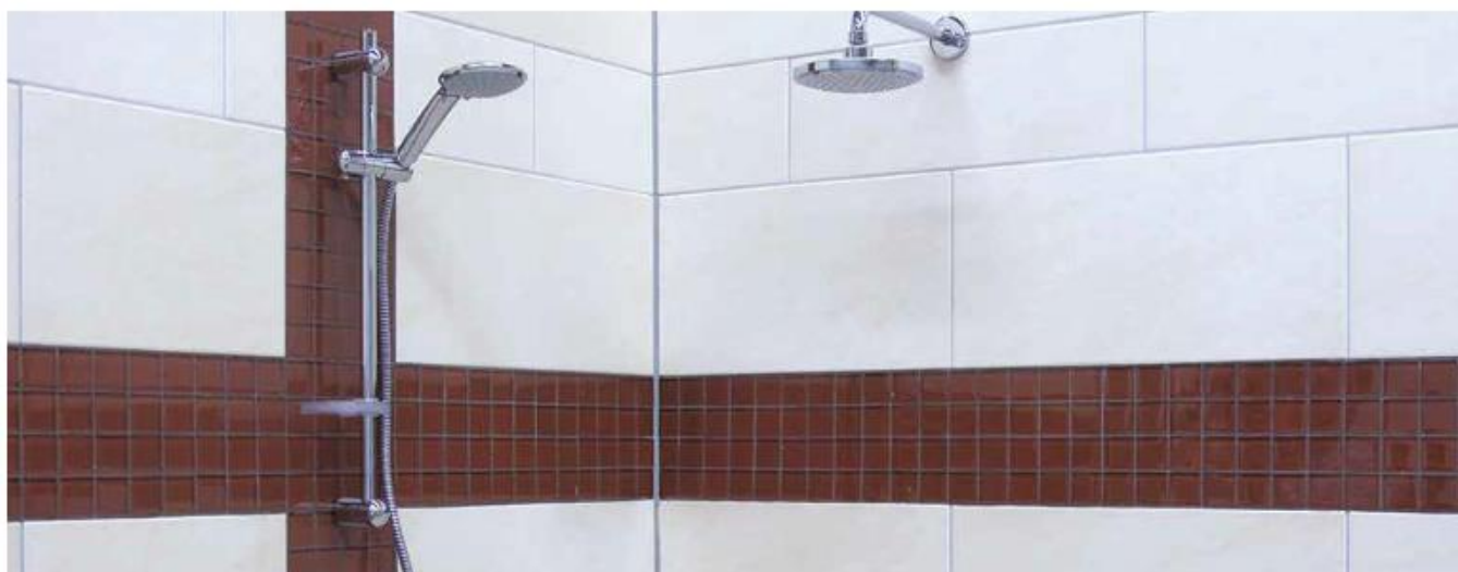
11 Okładzina w łazience zaspoimowana fugą Sopro DF 10®.