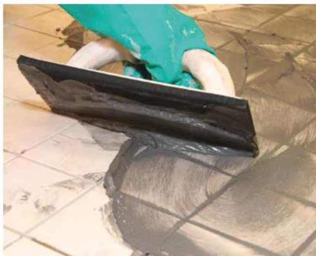
7 Spoinowanie płytek gresowych Design Fugą Flex Sopro DF 10®.