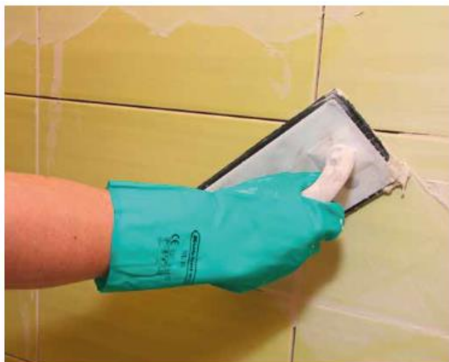
9 Spoinowanie ściennych płytek ceramicznych fugą Sopro DF 10®.