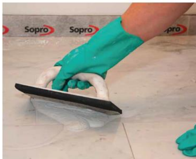
8 Spoinowanie wrażliwego na przebarwienia kamienia naturalnego fugą Sopro DF 10®.